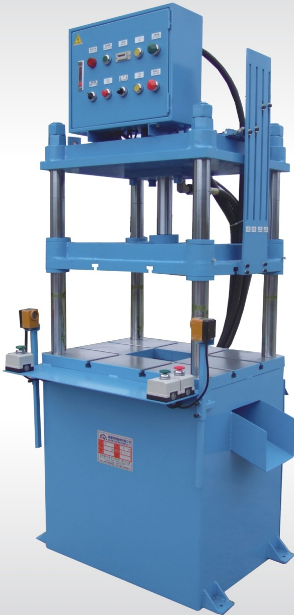
SF-4C-20T 油壓機 20T