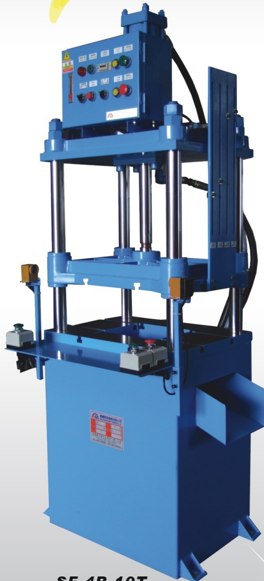
SF-4B-10T 油壓機 10T